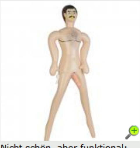
Nicht schön, aber funktional: Gummipuppe Big John.

Männliche Silikonpuppen bleiben dem Markt dennoch nicht vorenthalten. Auf realdoll.com kann sich jeder sein Exemplar nach den eigenen Vorlieben herstellen. Körperbau, Haut-, Augen- und Haarfarbe ebenso bestimmen wie die Beschaffenheit des besten Stücks. Kostenpunkt: 6000 Dollar, das sind umgerechnet rund 4600 Euro.