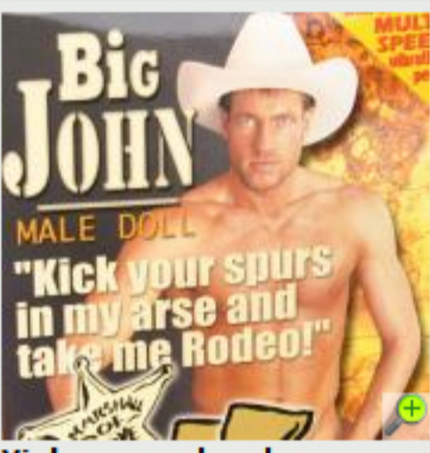
Vielversprechende Verpackung: Big John lockt mit Rodeospiele.